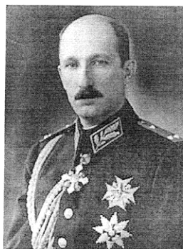
Цар Борис III (1918 – 1943г.)

Цар Борис III, който отхвърли настояването на Хитлер да бъдат избити евреите на България. С негова заповед е спрена акцията от 9.03.1943г. Той подписва план Б, с който 25 000 софийски евреи са изселени в провинцията и мъжете работят в трудови лагери в България. Малко след