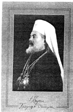
Кирил (1901-1971)-Български патриарх (1953-1971) Историк, доктор по богословие (1927), академик (1970), Стобийски епископ (1936), Пловдивски митрополит (1938), патриарх и софийски митрополит (1953).

Митрополит Кирил, (по-късно патриарх на Българската православна църква), поема събраните за депортиране евреи в Пловдив, под своя закрила и заявява, че ако ги натоварят във вагоните, той ще легне пред влака. През 1943 г. подкрепя и защитава съгражданите си евреи от Пловдив. Изпраща телеграма до цар Борис III със следното съдържание: "В Божие име усърдно моля Ваше Величество за милост към евреите!" За това си дело през 2000 г. е провъзгласен от организацията „Яд Вашем“ за „праведник на народите“, а наследниците му получават специална благодарствена грамота и почетен медал.