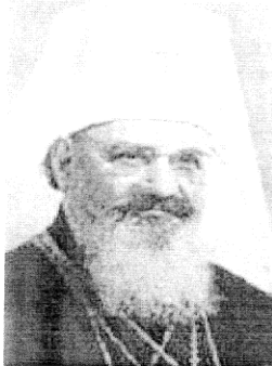
Стефан (1878-1957) – Български екзарх (1945-1948), Архимандрит (1911), епископ (1921), Софийски митрополит (1922), Ярък защитник на българските евреи в годините на Втората световна война.

През бурните години на Втората световна война, въпреки че е в близък контакт с двореца и правителството, владиката не споделя тяхната про-германска ориентация и е убеден миротворец. Усърден и